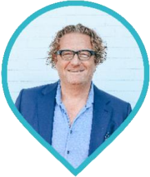
Arjen Elderson CEO

Graag komen wij met jou in contact om de mogelijkheden te bespreken of je vragen te beantwoorden. Wij kijken uit naar onze toekomstige samenwerking!