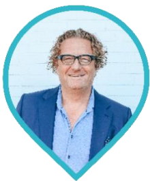
Arjen Elderson CEO

Graag komen wij met u in contact om de mogelijkheden te bespreken of uw vragen te beantwoorden. Wij kijken uit naar onze toekomstige samenwerking!